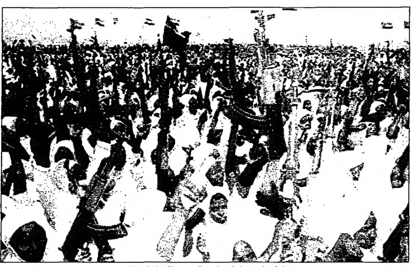
سودانيات يحملن أسلحة ضمن قوات المخلع الشعبي التي تشهدها الخرطوم لواجهة التمرديين

هجوم مسلحا تشهده المعارضة حسب ما علم من مقفي حملة التبرع هذه. وأكد امام مسجد في صنعاء مغرب من حزب التجمع اليمني للإصلاح الإسلامي المشارك في الائتلاف الحكومي ان جمع التبرعات بدأ الجمعة. واتت صحيفة الصباح صبحه ان حملة التبرع التي تشهدها الخرطوم لواجهة التمرديين بدأت في صنعاء يوم الجمعة. وقال مصدر مطلع ان حملة التبرع بدأت في صنعاء يوم الجمعة. وقال مصدر مطلع ان حملة التبرع بدأت في صنعاء يوم الجمعة.